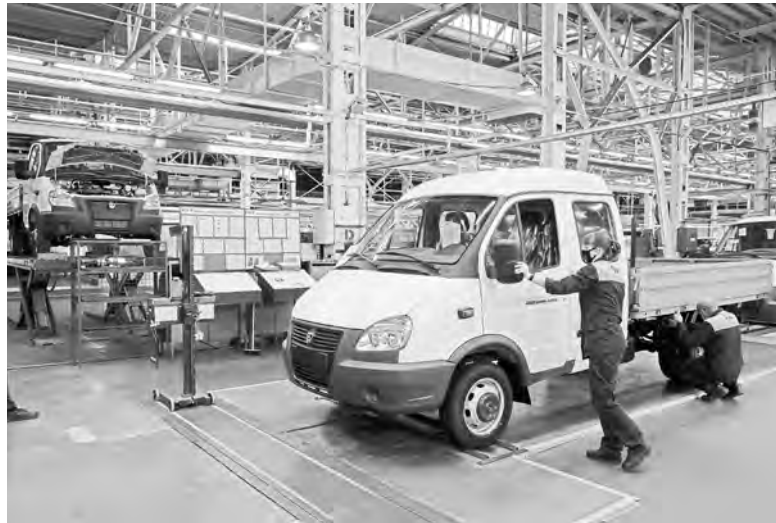
В цехах ждут молодых.

- Главная цель проекта - привлечь на предприятия молодые кадры. Необходимо презентовать школьникам достижения наших предприятий, познакомить их с