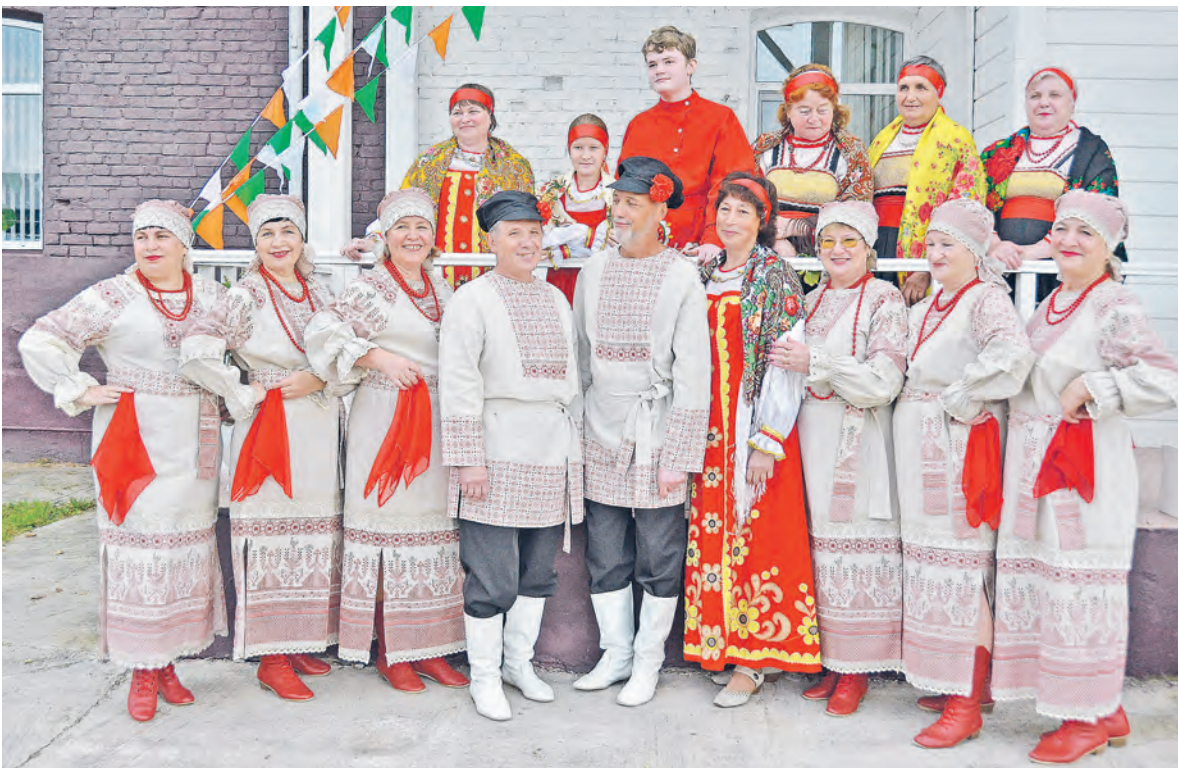
Участникам «Отрады» отрядно получить главный грант фестиваля.