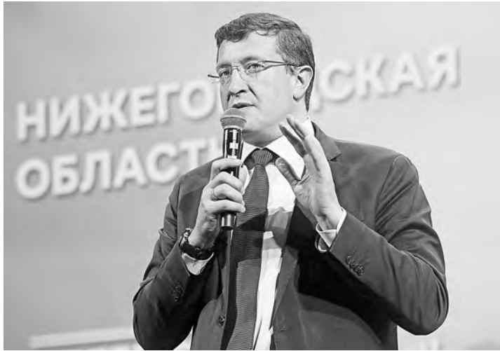
Глеб Никитин: «Регион движется вперёд».