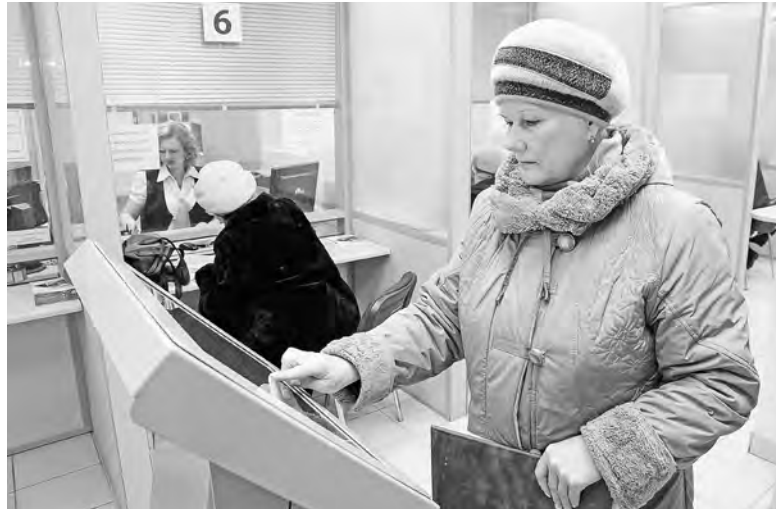
При личном обращении в отделение Социального фонда специалист даст подробную консультацию.

Представители ряда профессий могут рассчитывать на досрочную пенсию. В списке таких специальностей учитель, врач, водитель, лётчик, шахтёр и т.д. В Нижегородской области, к примеру, предоставленным правом воспользовались свыше 14 тысяч педагогов. Чтобы получить положенную выплату, необходимо иметь стаж работы не менее 25 лет в школах, детсадах, учреждениях дополнительного образования и требуемое количество коэф-