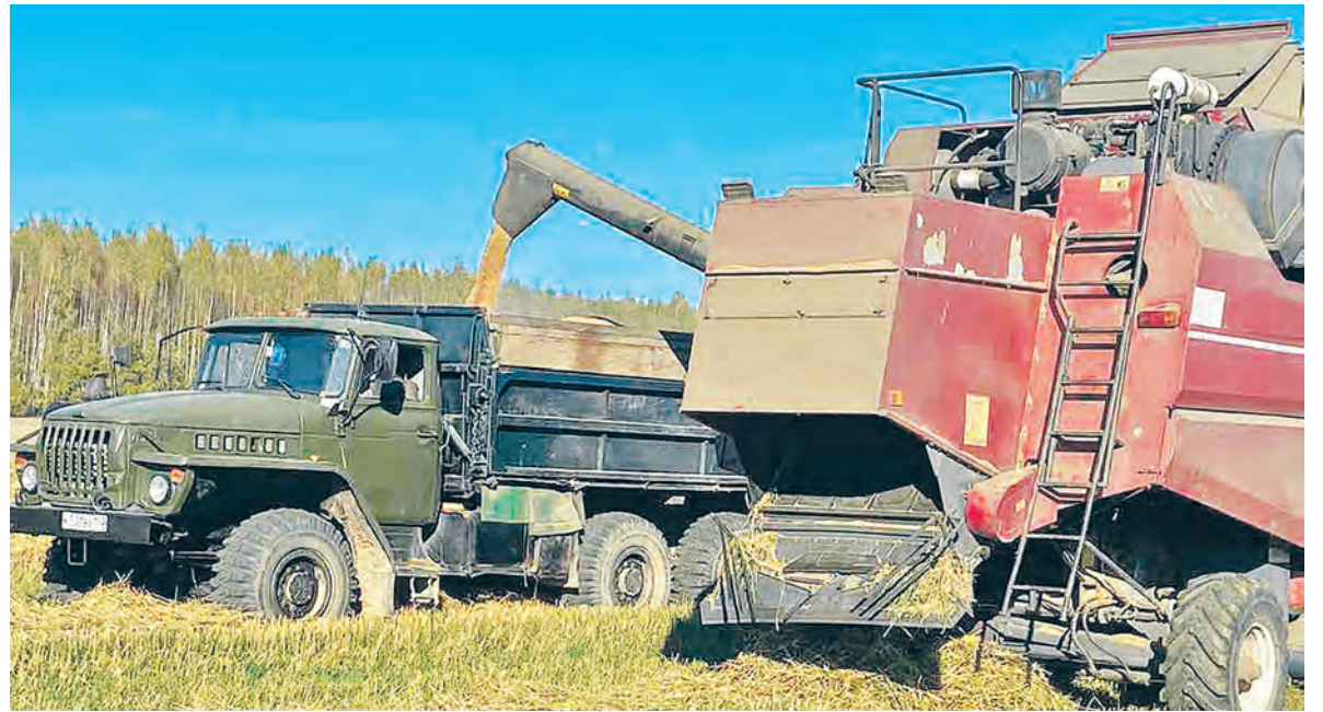
Комбайн отдаёт последние центнеры.