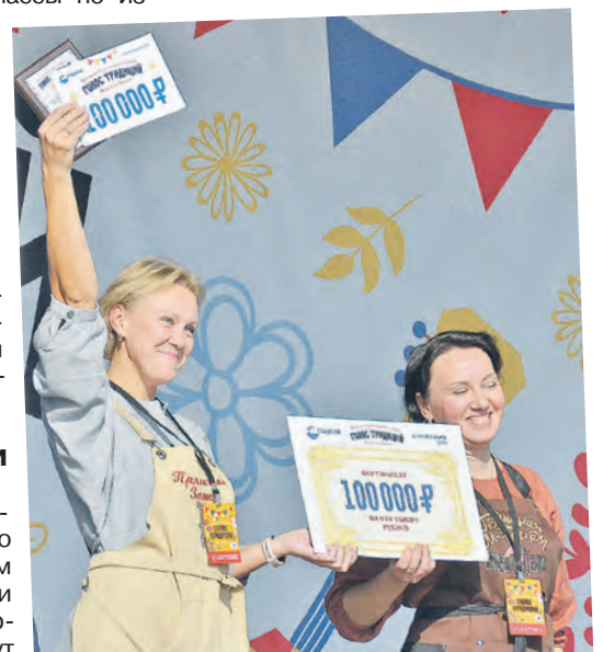
У победы мастеров из Балахны - пряничный вкус.