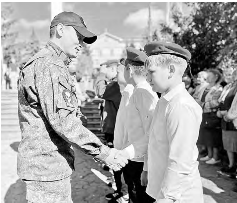
В юнармейцы посвящён.