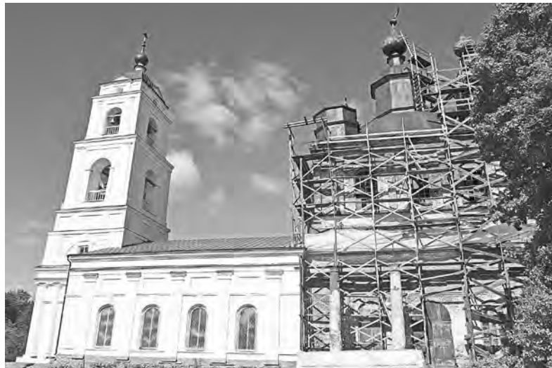
Колокольня уже полностью восстановлена.

Воскресенский округ.