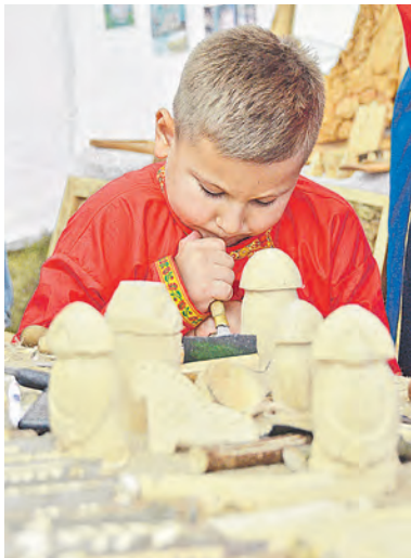
Найдется каждому учение согласно увлечению.