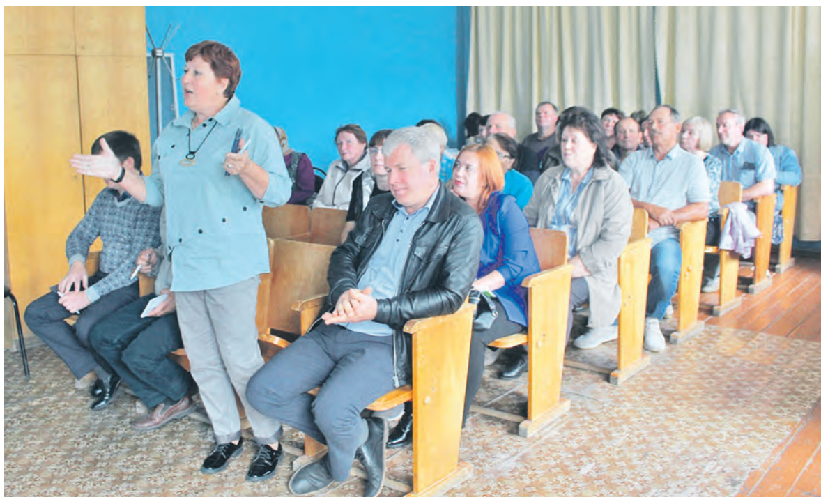
На встречах всегда люди с активной жизненной позицией.

Чтобы ускорить решение ряда вопросов, на встречи глава МСУ приезжает с представителями ресурсоснабжающих организаций - дирекции коммунального хозяйства, МУП «Водоканал», с начальником управления разви-