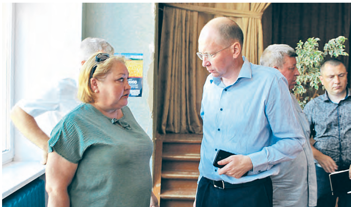
Конструктивный диалог с жителями Шандровского территориального отдела.

Лукояновский округ.