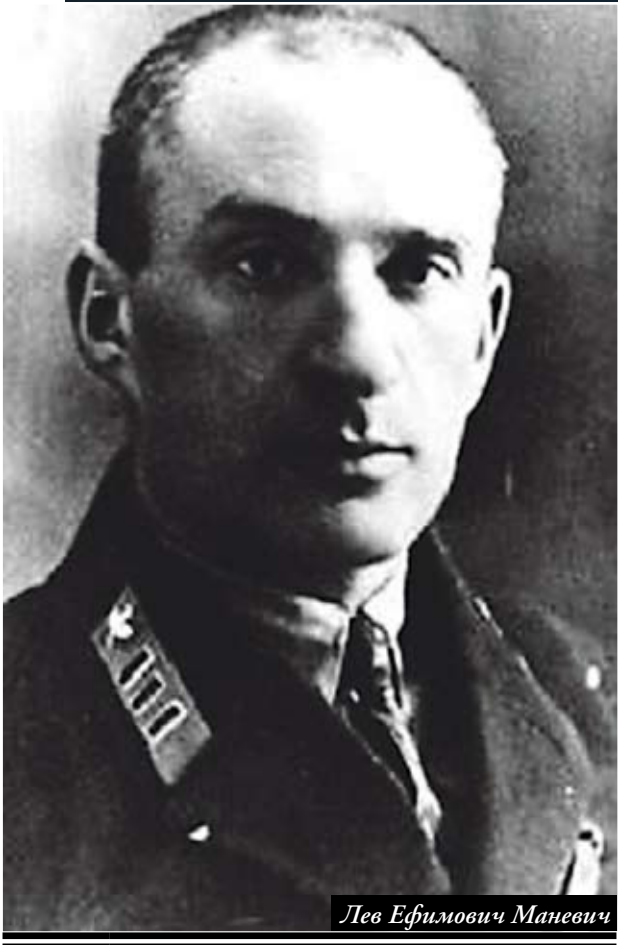
Лев Ефимович Маневич

После поездки в Барселону направил в Центр радиогрaмму, в которой предупредил о готовившемся Франко фашистском перевороте