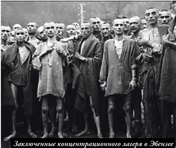
Заклученные концетрационного лагеря в Эбензее

После поездки в Барселону направил в Центр радиогрaмму, в которой предупредил о готовившемся Франко фашистском перевороте