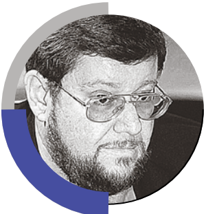
Евгений САТАНОВСКИЙ, президент Института Ближнего Востока

Вашингтон ничего не дал им взамен даже после того, как «старая гвардия» Хусейна поверила обещаниям и помогла истребить отряды «Аль-Каиды» в Ираке. Именно поэтому возникло, не без помощи Катара, «Исламское государство». Его франшизы в мусульманском мире не что иное, как националистические движения населения, исповедующего суннитскую ветвь ислама и стремящегося получить место под солнцем при установлении «справедливого общественного устройства».