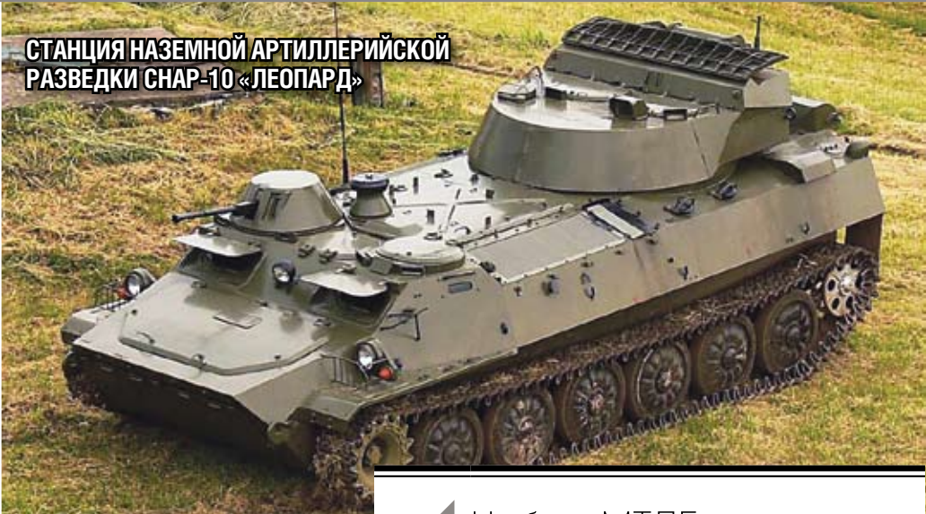
СТАНЦИЯ НАЗЕМНОЙ АРТИЛЛЕРИЙСКОЙ РАЗВЕДКИ СНАР-10 «ЛЕОПАРД»

На базе МТЛБ создано более 80 модификаций и специальных машин