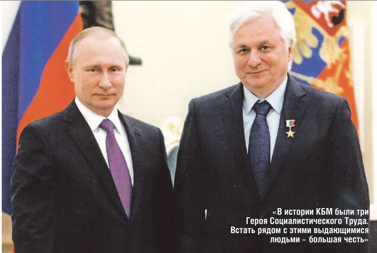
«В истории КБМ были три Героя Социалистического Труда. Встать рядом с этими выдающимися людьми – большая честь»

Один из первых контрактов мы заключили с Сингапуром – на поставку ПЗРК и создание комплекта пусковых модулей для «Иглы». Нам помогла замечатель-