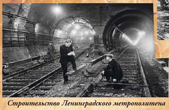
Строительство Ленинградского метрополитена