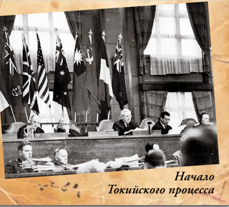
Начало Токийского процесса

лера и его друзей». 3 мая начинается Токийский процесс Международного военного трибунала по Дальнему Востоку. Сценарий аналогичен Нюрнбергскому. Ответственность за развязывание агрессии на Тихом океане официально возложена на японскую военщину. Процесс продлится до 12 ноября 1948 года. В общей сложности будет проведено 949 судебных заседаний. В обвинительном акте 55 пунктов: преступление против мира и человечности, массовые убийства («Рожденные коалицией», «ВПК», № 16, 2016). 15 марта Совет народных комиссаров СССР. 7 апреля образуется Кенигсбергская область. Бывшая «немецкая» становится частью РСФСР, извываясь от статуса оккупированной территории. Уже в июле ее переименовывают в Калининскую. 27 мая на встрече Сталина с Димитровым и Тито обсуждается создание Информационного бюро коммунистических и рабочих партий (Коминформа). Преземник распущенного Коминтерна востребован жизнью – начинается холодная война. Об осно-