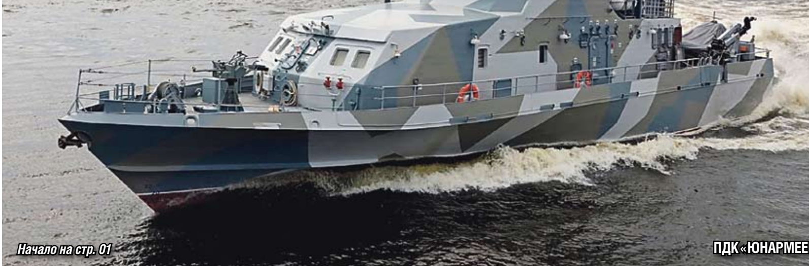
Начало на стр. 01