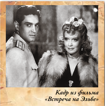
Кадр из фильма «Встреча на Эльбе»

18 января в Москве по решению экономического совещания представителей Болгарии, Венгрии, Польши, Румынии, СССР и Чехословакии подписывается протокол о создании Совета экономической взаимопомощи. 14 апреля приказом МПС создается управление по строительству метрополитена в Киеве. Выходит в прокат «Встреча на Эльбе» Григория Александрова. За год кинокартину посмотрят более 24 миллионов человек. 29 августа проводится испытание советской атомной бомбы РДС-1. 2 октября СССР первым устанавливает дипломатические отношения с Китайской Народной Республикой, на следующий день после фактического основания КНР. 21 декабря по всей стране