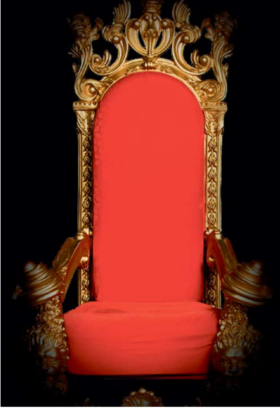
Коллаж Андрей СЕДУХ

ПОНИМАНИЮ РОЛИ ПЕРВОГО ЛИЦА РОССИИ НАМ НАДО УЧИТЬСЯ У ВРАГОВ