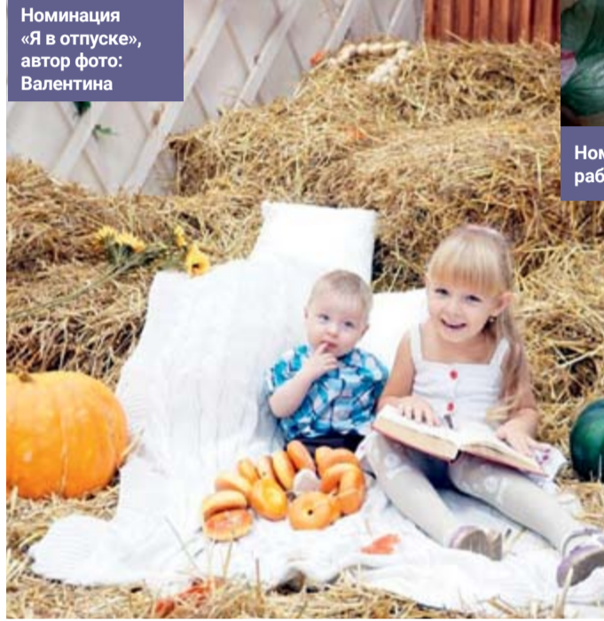
Номинация «Я в отпуске», автор фото: Валентина

Представляем вам фотографии, лидирующие в своих номинациях на момент вёрстки номера.